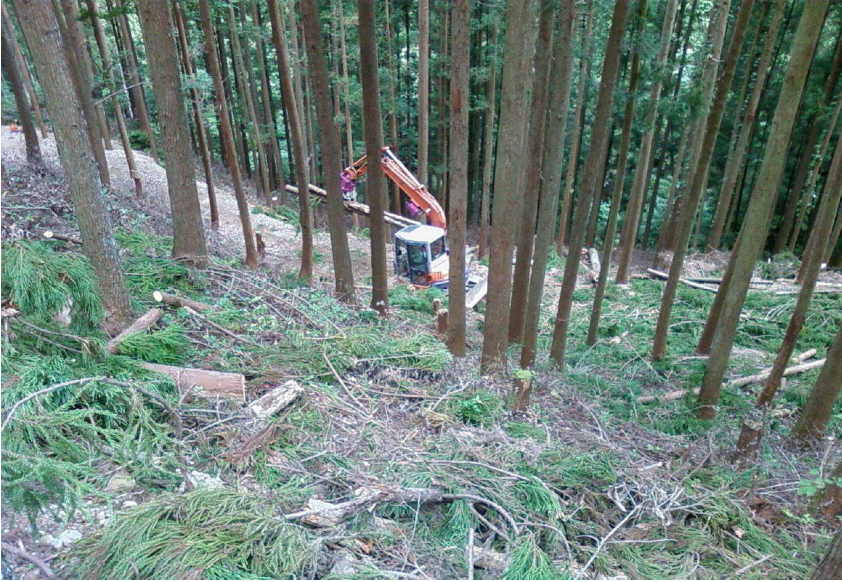
施業計画図の 区域を 南東側から北西方向を見通した 写真