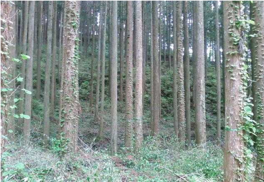
施業計画図の 区域のうち、 南西部を東側から西方向に 見通した写真 間伐前の状況