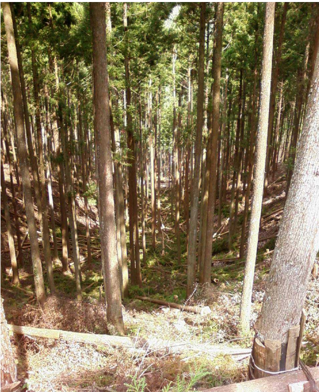
施業計画図の 区域のうち、 中央沢部を南東側(上流)から 北西(下流)方向を見通した写真 この部分は、ラジヤリによる 架線集材を併用したため、 架線予定の伐開線が中央に写っている。