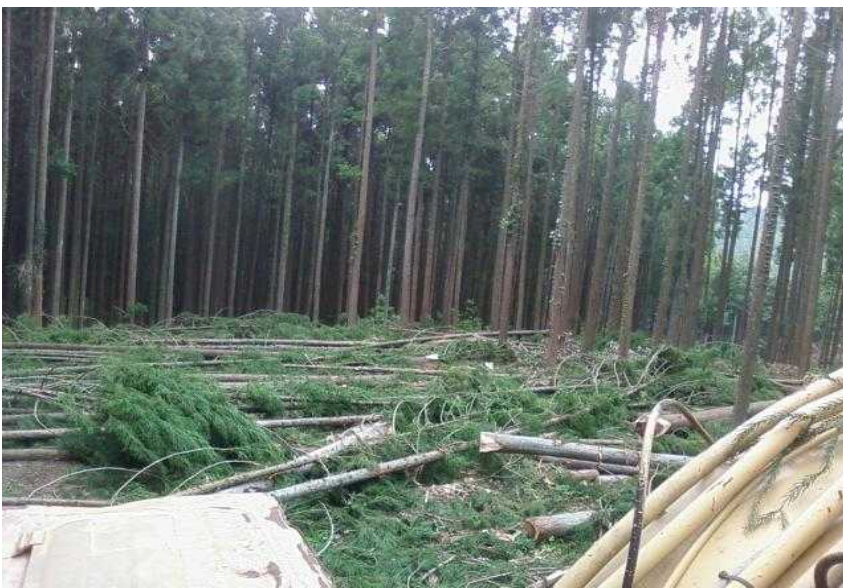
施業計画図 区域の南西端と 区域の南部との境界付近を 既設作業道に沿って集材土場 として伐開した部分