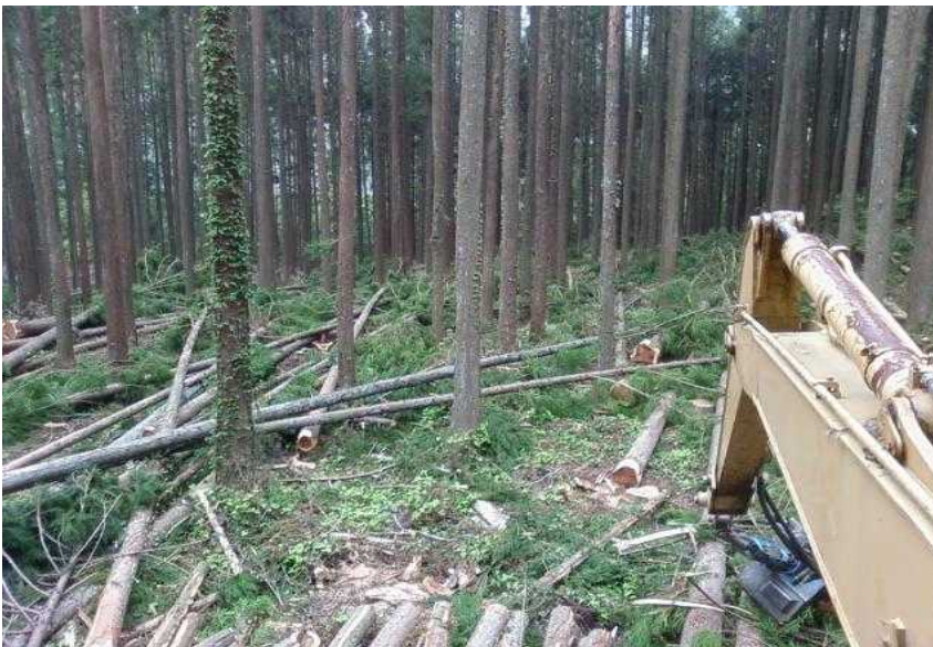
施業計画図 区域の南西端と 区域の南部との境界付近を 既設作業道に沿って集材土場 として伐開した部分