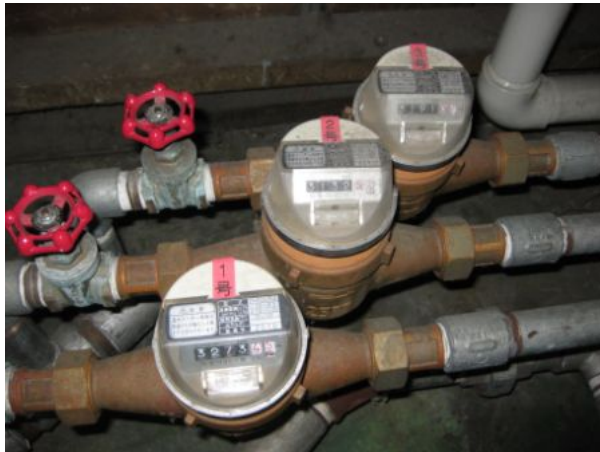
給水量のモニタリングに用いた温水メータ