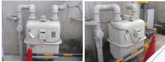
ボイラー用ガスメータ (2台)