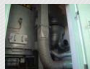
バイオマスバーナー