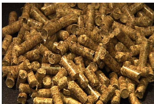
富山県産 杉 間伐材ペレット

森林資源が豊かな富山県に、ついに県産の木質ペレットが誕生しました。 名前は、「とやまペレット」です。 森林整備の際に発生する間伐材を有効利用して製造したもので、石油などの化石燃料の代わりとしてストーブやボイラーの燃料として利用されることを願っています。