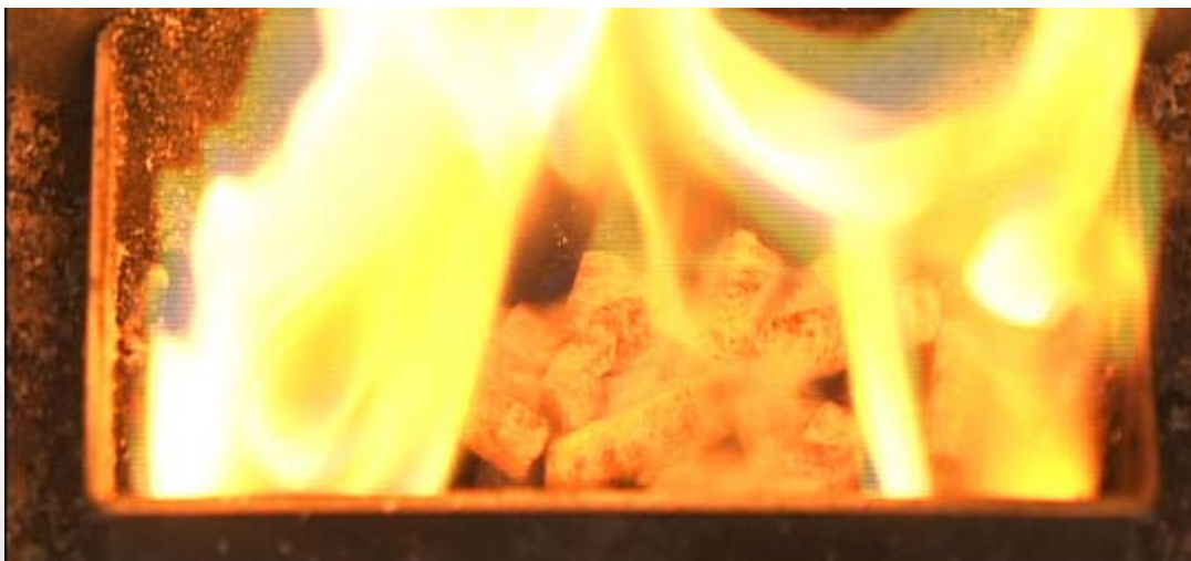
木質ペレットの燃焼