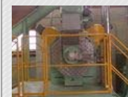
造粒機(ペレットミル)