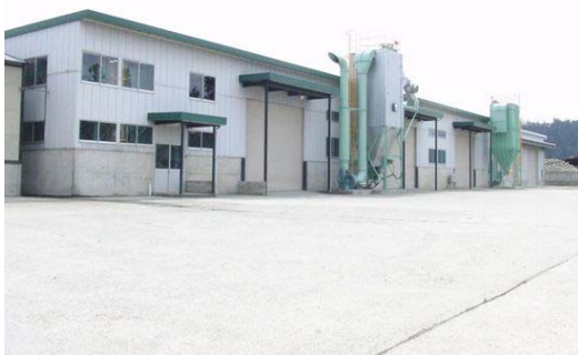
木質ペレット工場全景