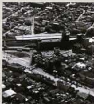
建設に入った天神町の米城ビル

昭和44年(1969)、西鉄天神大牟田線久留米駅を中心におよそ1.5kmの高架線が完成しました。高架化されたホームの下には久留米名店街がオープンし、周辺には大型店も次々に進出。これを機に西鉄久留米駅が商業の拠点へと生まれ変わりました。