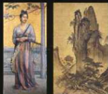
(左)藤島武二「天平の面影」 (右)雪舟「四季山水図」のうち秋幅

石橋美術館は、株式会社ブリヂストンの創業者・石橋正二郎が、「世の人々の楽しみと幸福の為に」という理念のもと、郷土である久留米市に石橋文化センターと共に寄贈したものです。氏のコレクションを中心に、青木繁、坂本繁二郎、古賀春江といったふるさと久留米の画家をはじめ、明治浪漫主義的な作風の絵画を多く残し石橋氏とも親交の深かった藤島武二の作品など、日本の近代絵画が数多く展示されています。別館では国の重要文化財に指定されている雪舟の「四季山水図」のほか、日本・東洋の書画や陶磁器類など、国宝や重要文化財級の美術品を展示。芸術文化の拠点として、多くの人が集い、楽しむ場として親しまれています。