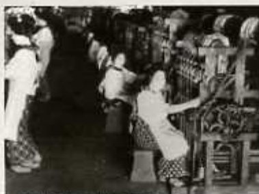
久留米絨工場

明治後期から大正、戦前にかけて、久留米市の経済は一気に活気づきます。それを支えていたのが「久留米絨」と「たび」の2大地場産業です。明治後期に工場生産となった久留米絨は、日露戦争の開戦とともに織物業界が不況に見舞われるなか、順調に生産を伸ばしていきました。また、たび製造においても「つちやたび(現・株式会社ムーンスター)」と「しまやたび(現・株式会社アサヒコーポレーション)」の2つのたび製造会社が互いにしのぎを削っていました。大正9年(1920)には久留米絨の生産額を、たびの生産額が上回るまでも勢いを増していきました。