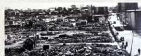
戦災を受けた都心部

昭和16年(1941)、太平洋戦争へ突入。国民全体がいやおうなく戦時体制の中に組み込まれていきました。そして昭和20年(1945)8月11日、久留米市は米軍機による空襲を受け、市街地の70%を焼失。被災状況は死者212名、焼失戸数4,506戸にまで及びました。