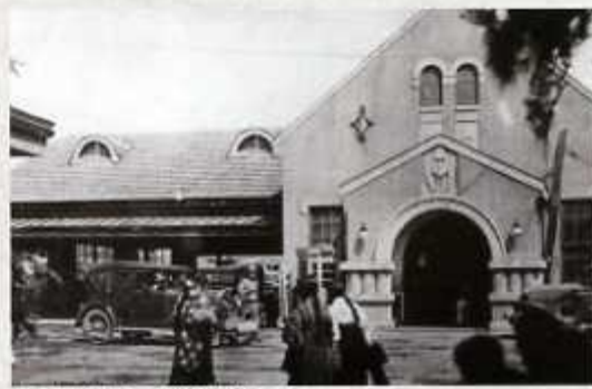
開通もない私鉄九州鉄道久留米駅

大正時代になると交通網が拡張されていきます。大正13年(1924)には、久留米～福岡間に私鉄九州鉄道(現・西日本鉄道株式会社)が開通し、久留米地方の交通に一大変革をもたらしました。また同じ頃、市営ガスの供給開始、市営住宅の建設など都市基盤の整備が着々と進められていきました。