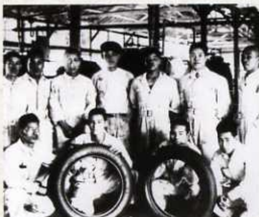
国産自動車タイヤ第1号完成

第一次世界大戦後、ゴム靴生産などのゴム産業を中心に久留米市の工業は進展しました。絨の生産が伸び悩むなか、昭和6年(1931)には、ブリヂストンタイヤ株式会社(現・株式会社ブリヂストン)が創立され、久留米は絨のまちからゴムのまちへと変容していきました。