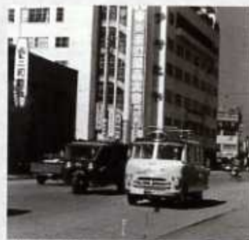
戦後の旭屋デパート