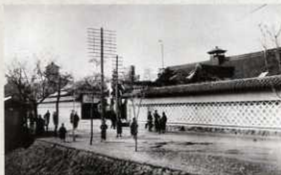
旧久留米市庁(旧藩時代の御使舎)