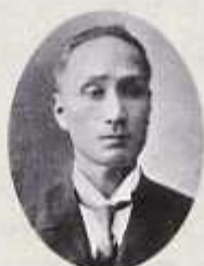
初代久留米市長 内藤新吾

明治22年(1889)4月1日、「市町村制」の施行により久留米市が誕生しました。当時、九州で市制施行したのは福岡、佐賀、長崎、熊本、鹿児島島の6市。当時の人口は24,750人、戸数は4,262戸でした。この時、初代市長に選ばれたのが、内藤新吾です。約5年間で、市長として教育、経済の発展に尽力しました。また、この年の12月、九州で初めての鉄道が久留米～博多間(現・JR)で開通しました。