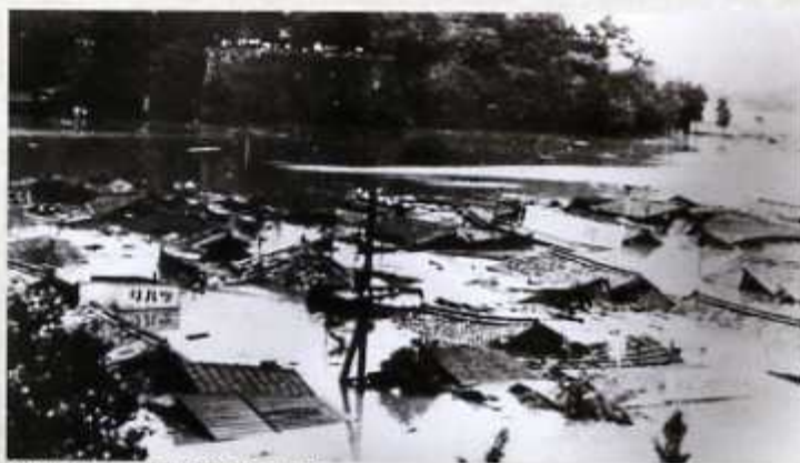
久留米大学から見た旭町住宅と護山城跡

筑後川流域最大の都市である久留米市は、過去に幾度も大洪水の被害を受けてきました。なかでも、最も大きな被害を出したのが、昭和28年(1953)6月の大洪水です。記録的な豪雨により、堤防が決壊。久留米市における被災者は、47,885人、被災家屋は9,857戸にものぼりました。