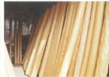
天然・人口絞丸太