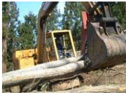
重機に乗ると目つきが変わるタイプ！