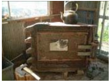
重機のバケットで こんなストーブも造ってみました