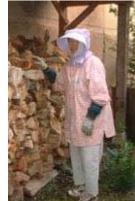
ただ働きのおふくろ、ありがとう