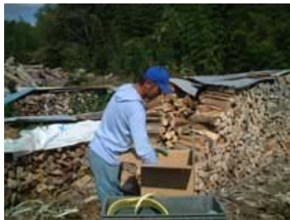
あだ名はマチャコ(日本製)