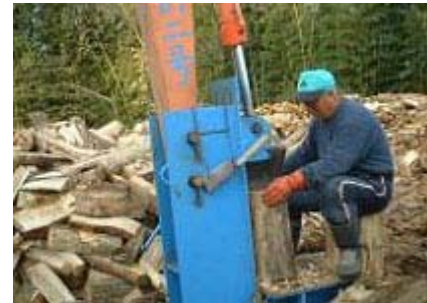
男は黙って薪を割る。以上！