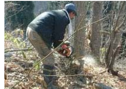
この人の体内には焼酎が 流れているはずだ。きっと。