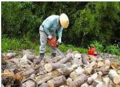
チェーンソーを持つとこの人は別人に！