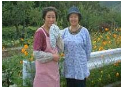
いつもおいしいお茶をありがとう