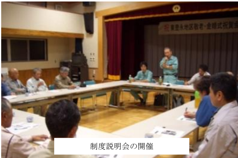
制度説明会の開催

また、①プロジェクト代表事業者である県からプロジェクト事業者あて、②プロジェクト代表事業者及びプロジェクト事業者から森林所有者あてに「当プロジェクトに係る森林施業計画の遵守について」文書で通知するとともに、③プロジェクト事業者からプロジェクト代表事業者である県あてに「当プロジェクトに係る森林施業計画について」遵守する旨の文書を交わすことにより永続性を担保した。